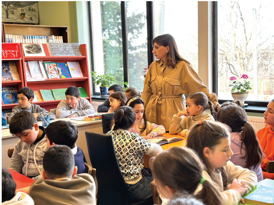
ნეთ კითხვის პოპულარიზაციაში.

ენტრებული ვართ ახალგაზრდა თაობის განათლება-განვითარებაზე. ჩვენი დიდი სურვილია, რაც შეიძლება მეტი ახალგაზრდა მკითხველი გვყავდეს. ამისათვის ვეძინით ისეთ გარემოს, სადაც ბავშვები თავს მაქსიმალურად კომფორტულად იგრძნობენ. დღის ნებისმიერ მონაკვეთში მოსწავლეებს შესაძლებლობა უნდა ჰქონდეთ მეგობრებთან ერთად შეიკრიბონ, მოაზაღონ პრეზენტაციები, იმუშაონ სხვადასხვა პროექტებზე და, რაც მთავარია, ხელი მოუწვდებოდეთ ახალ, თანამედროვე მრავალფეროვან ლიტერატურაზე.